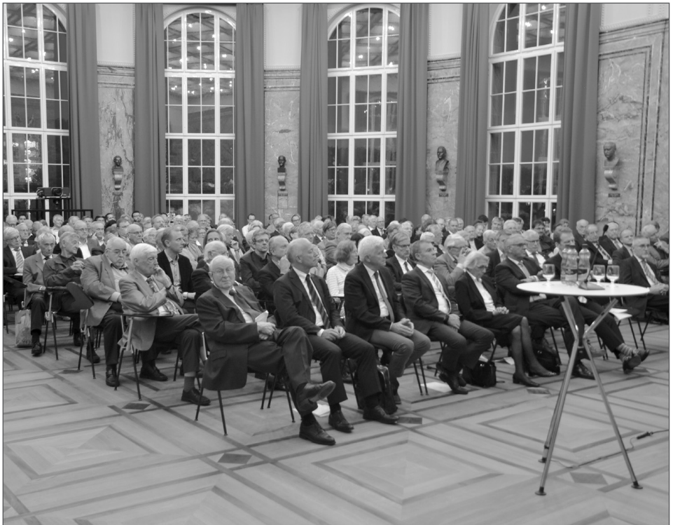
Vollbesetzte Aula anlässlich der Buchvernissage an der Universität Zürich.