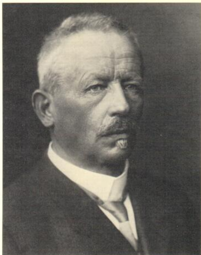
Eduard Will 1854 – 1927