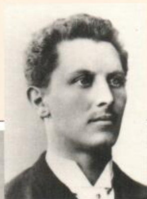
Walter Boveri 1865–1924