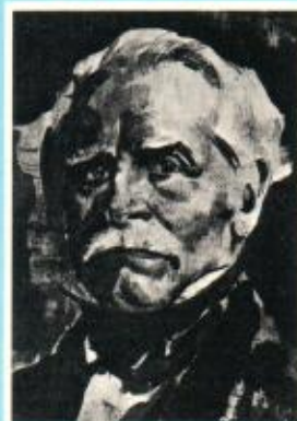
Franz Saurer (1806–1882)