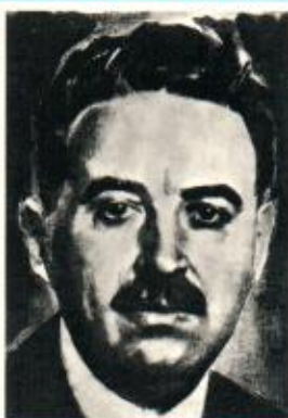
Hippolyt Saurer (1878–1936)