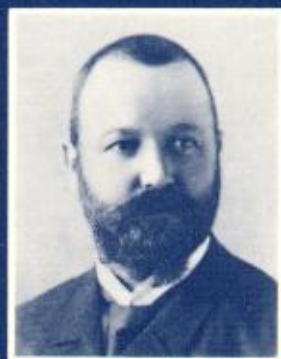
Edouard Sandoz (1853–1928)