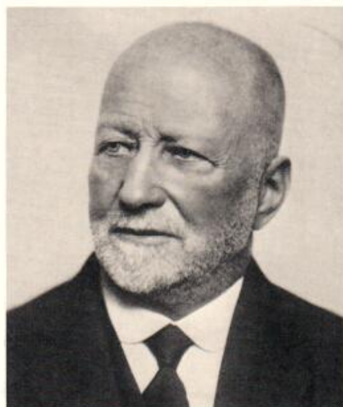
Wilhelm Preiswerk 1858–1938