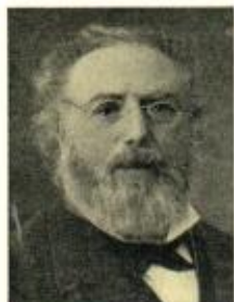
G. PH. HEBERLEIN